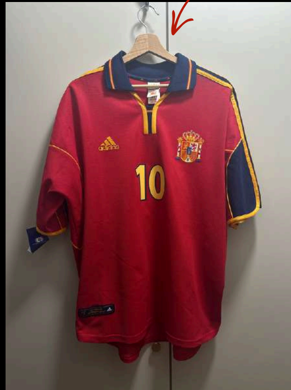
AVANT DU MAILLOT SUR CINTRE

CINTRE PREMIUM UNIQUEMENT (PAS DE CINTRES MÉTAL)