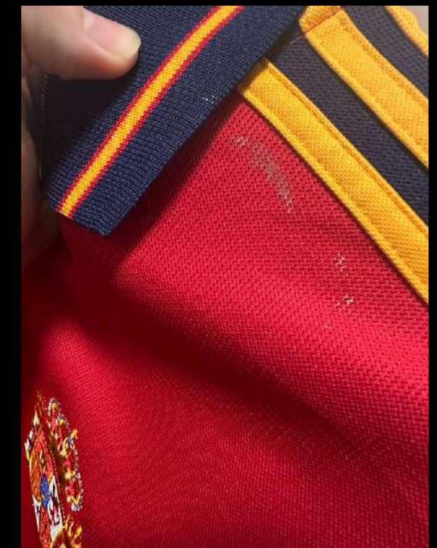
DÉFAUTS POTENTIEL DÉTAILS IMPORTANTS

SANS TOUTES CES PHOTOS, LE PRODUIT POURRAIT NE PAS ÊTRE VALIDÉ