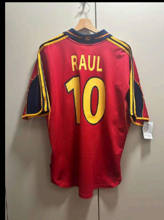
ARRIÈRE DU MAILLOT SUR CINTRE